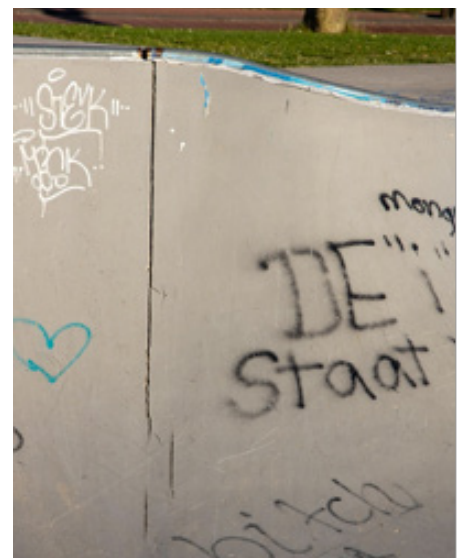
Spleten in de baan en coping