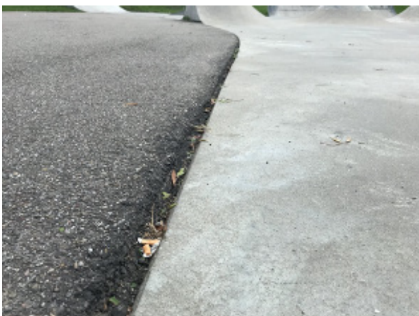
Grote spleten tussen asfalt en beton