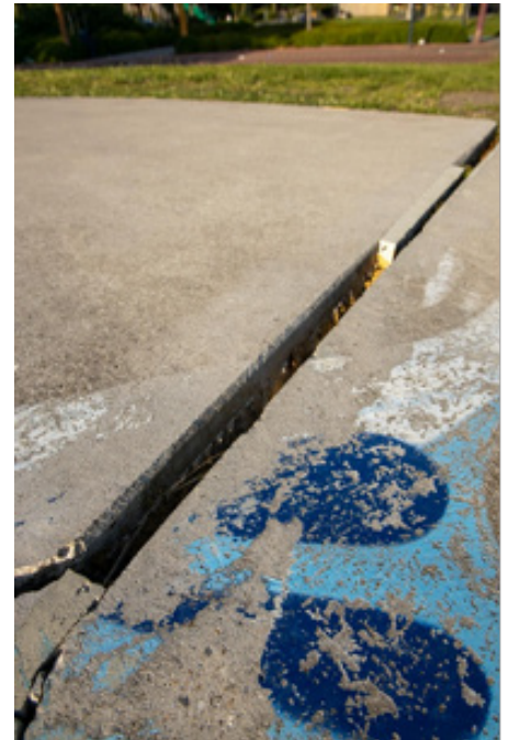
Spleten in de grond

De hoogste tijd dat de gemeente Leiden de urban sports meer ruimte geeft! Eén groot centraal urban sportpark draagt hieraan bij!