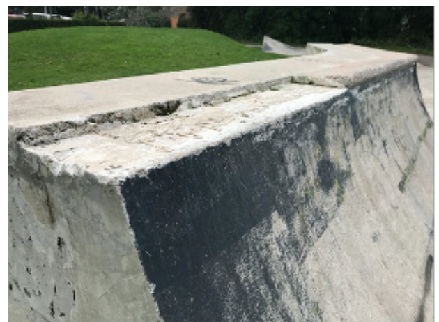
Ontbrekende poolcoping tegels