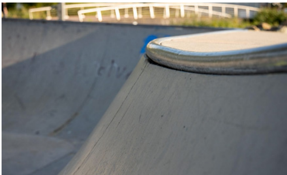
Tussenruimte onder de coping